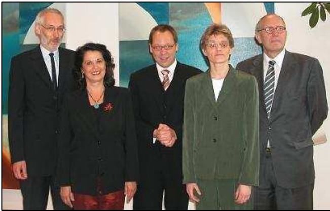
Vor der Preisverleihung