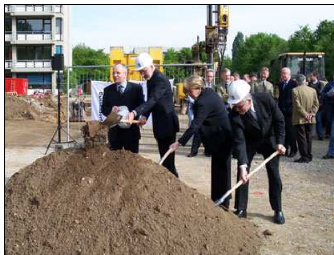
Spatenstich zum Bau des Juridicum II im Mai 2004