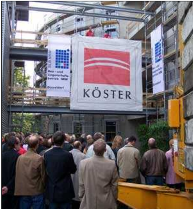
Richtfest für das Juridicum II im September 2004