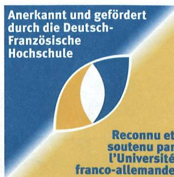
Abb. 1: Förderung durch die Deutsch-Französische Hochschule

Die Juristischen Fakultäten der Université de Cergy-Pontoise und der Heinrich-Heine-Universität Düsseldorf haben zum Wintersemester 2005/2006 einen integrierten deutsch-französischen Studiengang eingerichtet, der im Oktober 2005 mit 13 Studierenden auf französischer und elf Studierenden auf deutscher Seite erfolgreich gestartet ist. Der zweite Jahrgang wird im Oktober 2006 mit voraussichtlich jeweils 18 Studierenden aus Cergy-Pontoise und Düsseldorf beginnen.