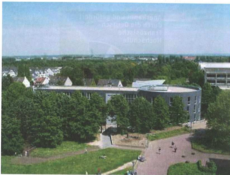
Abb. 2: Das neue Gebäude der Juristischen Fakultät in Düsseldorf

Zwischen der Université de Cergy-Pontoise und der Heinrich-Heine-Universität Düsseldorf besteht bereits seit vielen Jahren eine ERASMUS-/SOKRATES-Partnerschaft, in deren Rahmen deutsche und französische Jurastudierende ein Studienjahr an der Partnerfakultät verbringen. Die Juristische Fakultät in Cergy-Pontoise bietet, nicht zuletzt wegen der Nähe zu Paris und den vielen dort tätigen internationalen Anwaltskanzleien und Unternehmen, seit ihrer Gründung vor etwa 15 Jahren eine spezielle Ausbildung an, die Rechtswissenschaften und Sprachen sowie die Kenntnis ausländischer Rechtsordnungen miteinander verbindet. Daher bildet sie Jurastudierende zusätzlich auch im deutschen Recht und in der deutschen Sprache aus. Vor der Umstellung auf das Bachelor-Master-System wurde diese Ausbildung mit dem Universitätsdiplom „Deutsches Recht“ („diplôme universitaire de droit allemand“) abgeschlossen; heute können die Studierenden zusätzlich zur „licence en droit“ ein Diplom als zweisprachige Juristin bzw. zweisprachiger Jurist im deutschen Recht („diplôme universitaire juriste bilingue allemand“) erwerben. In Düsseldorf finden ebenfalls in jedem Semester Vorlesungen zur Einführung in das französische Recht statt, in denen die Studierenden Abschlussklausuren schreiben und entsprechende Leistungsnachweise erwerben können.