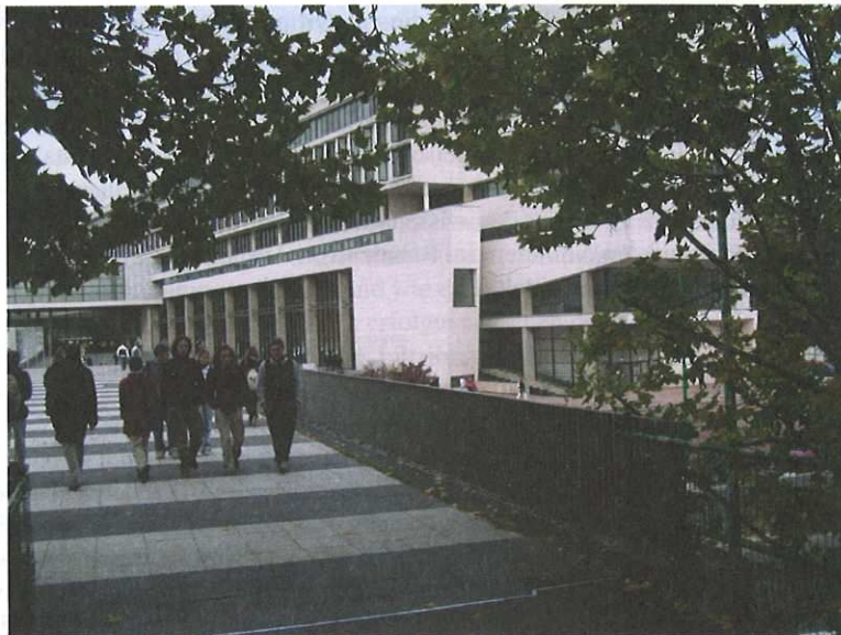
Abb. 3: Das Gebäude der geisteswissenschaftlichen Fakultäten in Cergy-Pontoise

Ziel dieses integrierten Studiengangs ist es, den Studierenden eine fundierte Ausbildung in beiden Rechtsordnungen und Rechtskulturen zu vermitteln, die es ihnen ermöglicht, im grenzüberschreitenden Rechtsverkehr, aber auch in internationalen Organisationen tätig zu werden. Die Ausbildung soll nicht nur die theoretischen Inhalte und die Fähigkeit zum wissenschaftlichen Arbeiten in zwei Rechtsordnungen vermitteln. Großes Gewicht wird ebenfalls auf die praktische Ausbildung, vor allem im Rahmen von Auslandspraktika, sowie auf interkulturelle Fähigkeiten gelegt. Deshalb studieren die Teilnehmerinnen und Teilnehmer des Studiengangs nach dem ersten Jahr, das sie zur Eingewöhnung noch an ihren Heimatfakultäten verbringen, während der beiden weiteren Studienjahre als gemeinsame deutsch-französische Studiengruppe, und zwar ein Jahr in Düsseldorf und ein Jahr in Cergy-Pontoise. Dieses gemeinsame zweijährige Studium französischer und deutscher Studierender ist eine Neuheit bei den integrierten rechtswissenschaftlichen Studiengängen.