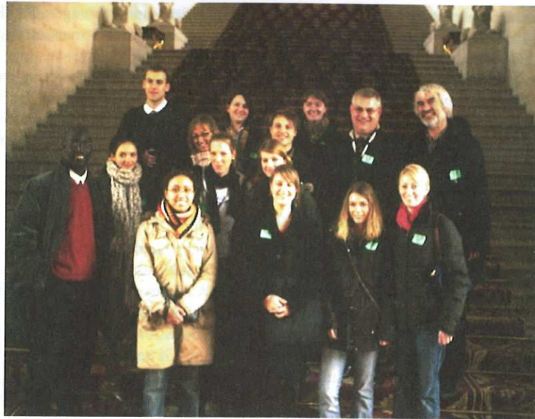
Abb. 4: Die deutsche Studiengruppe im Senat in Paris am 20. Februar 2006

nes französischen Rechtsanwalts. Abgeschlossen wurde das offizielle Programm auf dem Pariser Friedhof Montmartre, wo die Studierenden gemeinsam eine Rose am Grab von Heinrich Heine niederlegten. Der in Düsseldorf geborene Dichter lebte in Paris, ohne Deutschland ganz vergessen zu wollen. An diesem Februartag 150 Jahre nach seinem Tod fühlten sich die Studierenden des deutsch-französischen Studiengangs dem Namensgeber unserer Universität besonders nahe.